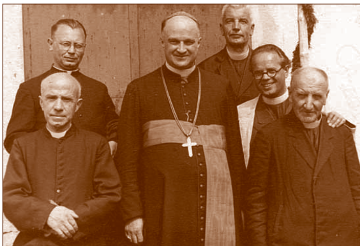
Biskup Vovk ze swymi księżmi podczas uroczystości bierzmowania w Gozd w 1950 r.