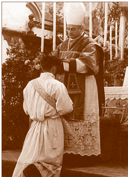
Święcenia kapłańskie w Ljubljanie 29 czerwca 1950 r.