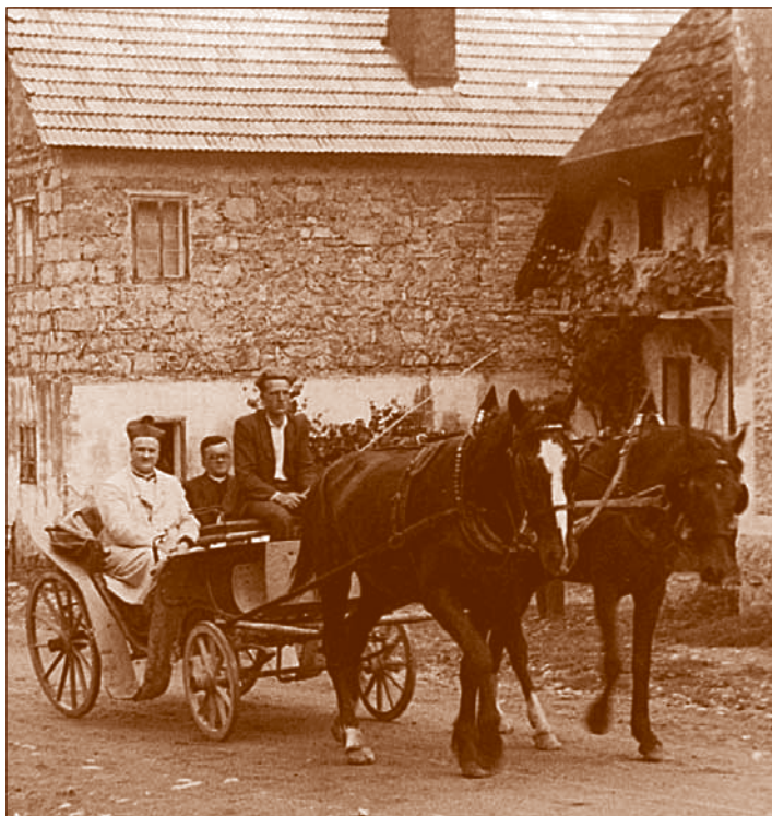
Wyjazd na uroczystość bierzmowania do miejscowości Grahovo w 1948 r. Władze uniemożliwiły użycie samochodu. Biskup podróżował »wesolo« zaprzęgiem konnym.