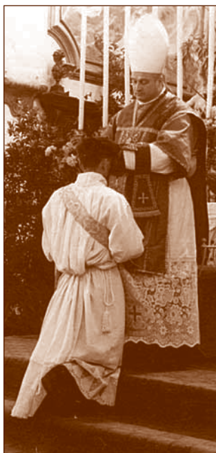
Posvečevanje novomašnikov v Ljubljani, 29. junija 1950.

Vovkova največja skrb in ljubezen so bili sobratje duhovniki. Vedno jih je rad sprejel na pogovor v škofijo, se z njimi družil, jih bodril in jim vlival poguma. Kolikokrat je zanje posredoval pri organih oblasti, UDV, verski komisiji, pa čeprav, žal, skoraj vedno brez uspeha. V duhovni oporoki je zapisal: »Hudo mi je, ko ne morem danes posvetiti novomašnikov. Molim, da bi bili dobri. Ohrani jih, Gospod, in blagoslovi vse naše duhovnike! Neizmerno jih imam rad. Zato ker so Gospodovi in zanj delajo in trpijo. Zelo mi je hudo, če sem bil kdaj s kom bolj trd. Res, le potreba je to prinesla in moji zmučeni živci. Sproti sem rad odpuščal, vse pozabil, in za isto prosim tudi vse svoje drage sobrate.« Izredno skrb je imel tudi do redovnikov in redovnic, saj so mnoge redove v Sloveniji prepovedali, redovnike pa preganjali. Njegovo skrb in človečnost lepo oriše dejanje zadnjega dneva življenja, ko je bolni redovnici v bolnišnico poslal voščilo in breskve.