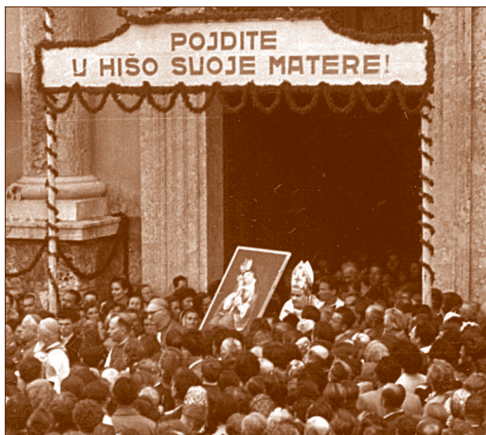
Škof Anton Vovk je bil velik Marijin častilec. Ob 50-letnici kronanja brezjanske Marije Pomagaj na Brezjah, 1. septembra 1957.

Škofijski postopek za beatifikacijo je bil končan v Ljubljani, 12. oktobra 2007. Vsa dokumentacija je bila izročena Kongregaciji za zadeve svetnikov v Rimu 26. oktobra 2007.