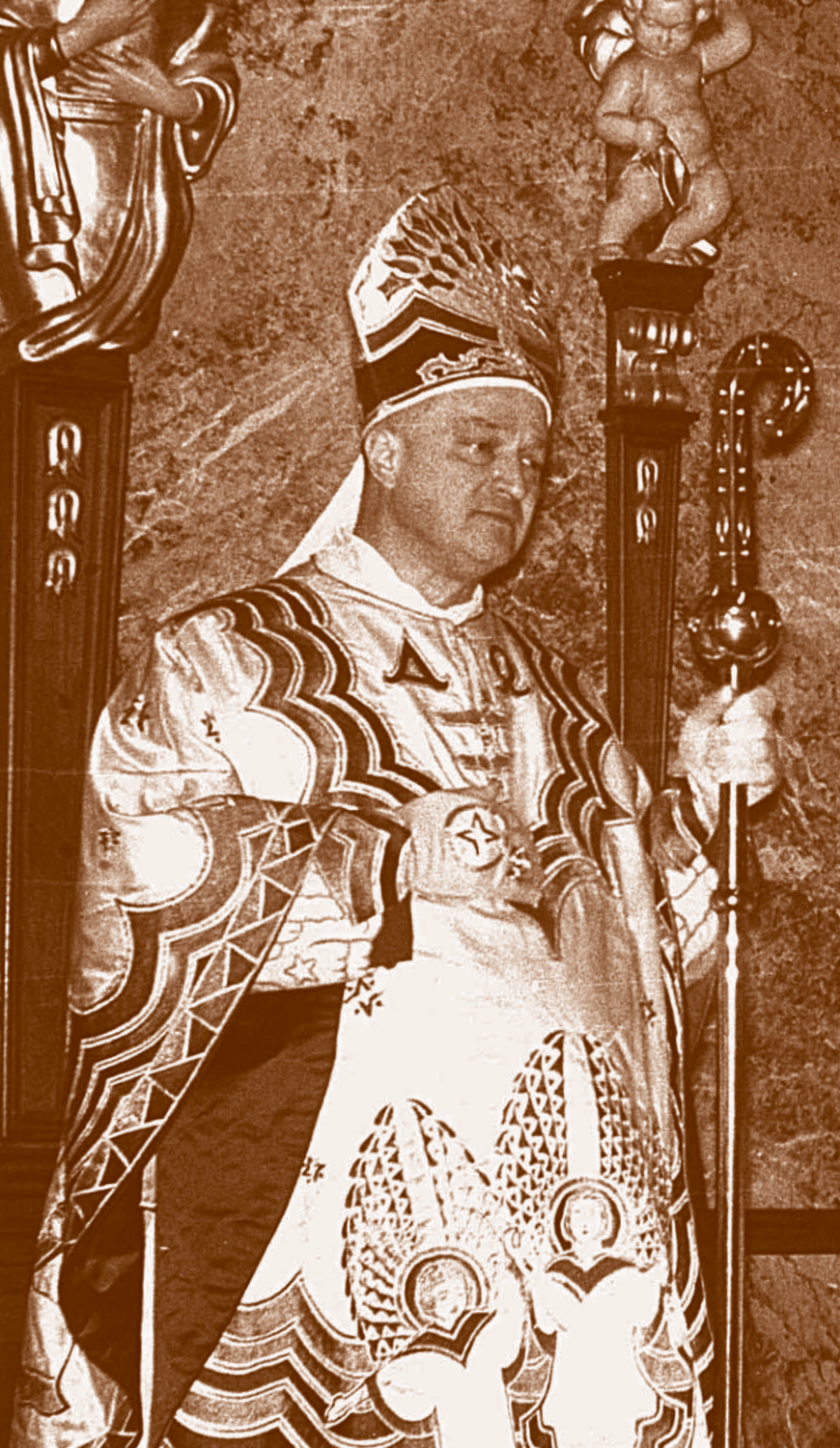
Dr. Anton Vovk pri ustoličenju za nadškofa v ljubljanski stolnici, 4. marca 1962.