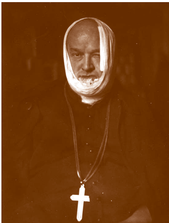
Škof Anton Vovk po zažigu v Novem mestu, 20. januarja 1952.

Višek nasilja nad škofom je predstavljal zažig v Novem mestu. Škof Vovk se je 20. januarja skupaj s spremstvom iz Ljubljane z vlakom odpeljal proti Novemu mestu, da bi v župniji Stopiče blagoslovil obnovljene orgle. Že med vožnjo do Novega mesta je bil v enem izmed predorov polit s smrdljivo mastno tekočino. Ko je vlak prispel do novomeške železniške postaje, je škof skupaj s spremstvom izstopil. Tam je bila zbrana množica protestnikov, ki je škofa pričela zasramovati in z njim fizično obračunavati. Divja množica ga je potisnila nazaj